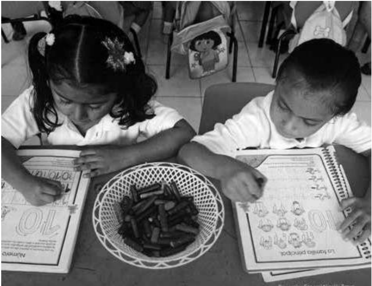
Evidencias de trabajo con el Grupo