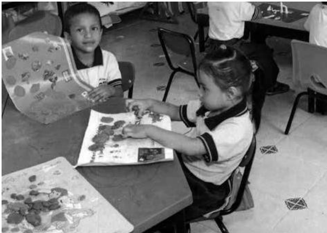
Evidencias de trabajo con el Grupo 1 * descripción de la actividad

A continuación, se presentan algunos ejemplos de fotografías: